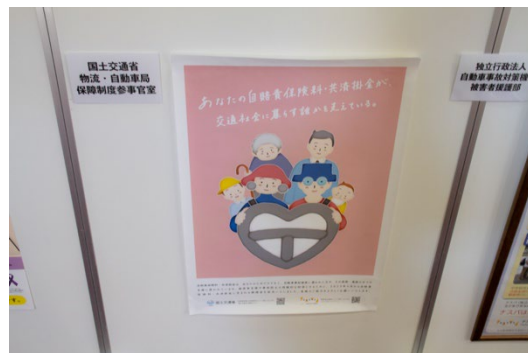
国土交通省 物流・自動車局保障制度参事官室