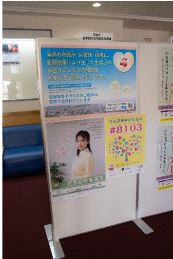
警察庁 犯罪被害者等施策推進課