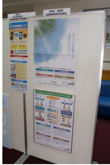
(左) 総務省 総合通信基盤局電気通信事業部利用環境課