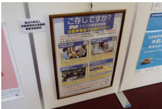
独立行政法人 自動車事故対策機構被害者援護部