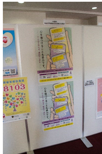
内閣府 男女共同参加局男女間暴力対策課