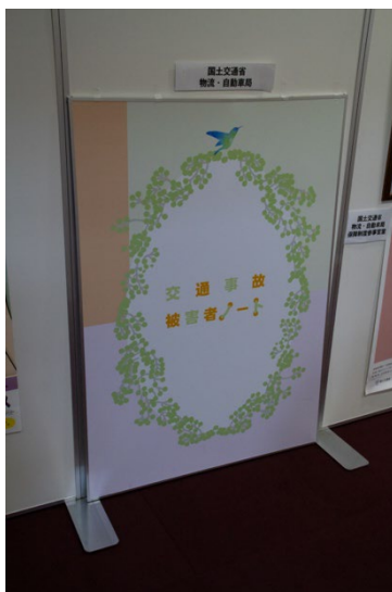
国土交通省 物流・自動車局