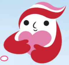
犯罪被害者等支援シンボルマーク 「ギョットちゃん」