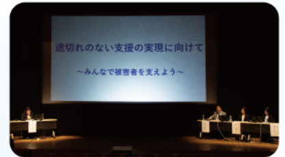
● パネルディスカッション