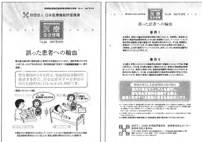
図表Ⅲ-3-14 医療安全情報No.111「誤った患者への輸血」